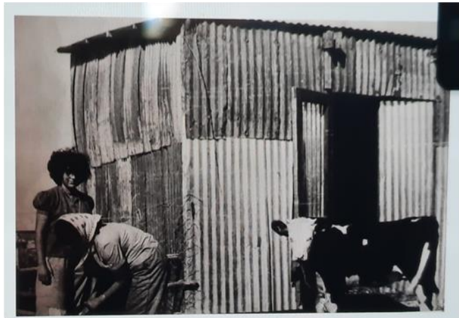
חדר האוכל הראשון